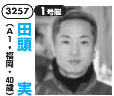
炎のロケットダッシュで一気に先制勝ちへ。