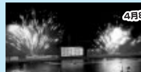
4月8日(最終日)、優勝戦のゴールに合わせてビクトリー花火