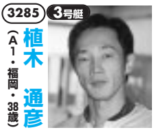
勝利への執念が上位獲りへ迫りカハンドル。