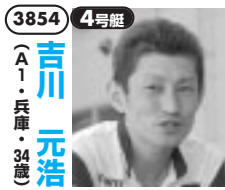
当地12連勝完全優勝、記録をまだ伸ばす。