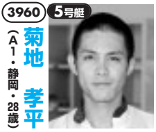
当地はSG初優勝の水面、自在強ダッシュ。