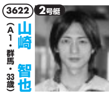
艇界の貴公子はハイレベルなコーナー勝負。